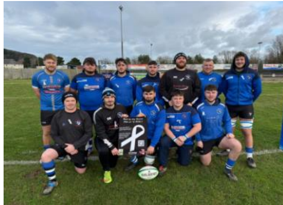
Tîm Rygbi Abergwaun ac Wdig

Mae Ffederasiwn Powys Brycheiniog wedi recriwtio nifer o gorau, gan cynnwys Côr Meibion Aberhonddu a'r Ardal a Chôr Meibion Talgarth, a gwisgwyd rhubanau gwyn yn ystod eu perfformiadau. Yn ogystal, mae'r Ffederasiwn wedi debyn cefnogaeth Clwb Bowlio Penlan a Chyngor Tref Aberhonddu.