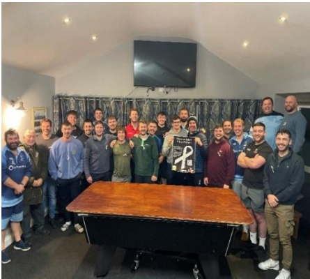
Clwb Rygbi Arberth

Sefydlodd Ffederasiwn Sir Benfro gysylltiadau â Thîm Rygbi Arberth, Clwb Rygbi Abergwaun ac Wdig a Sied Dynion yr Eglwys Lwyd, ynghyd a sicrhau eu cefnogaeth.