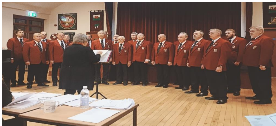
Côr Meibion Aberhonddu a'r Ardal

Mae Ffederasiwn Powys Brycheiniog wedi recriwtio nifer o gorau, gan cynnwys Côr Meibion Aberhonddu a'r Ardal a Chôr Meibion Talgarth, a gwisgwyd rhubanau gwyn yn ystod eu perfformiadau. Yn ogystal, mae'r Ffederasiwn wedi debyn cefnogaeth Clwb Bowlio Penlan a Chyngor Tref Aberhonddu.