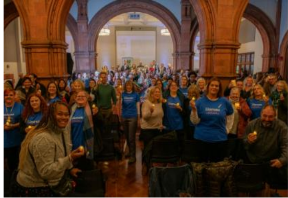
Gwylnosau yng ngolau canhwyllau